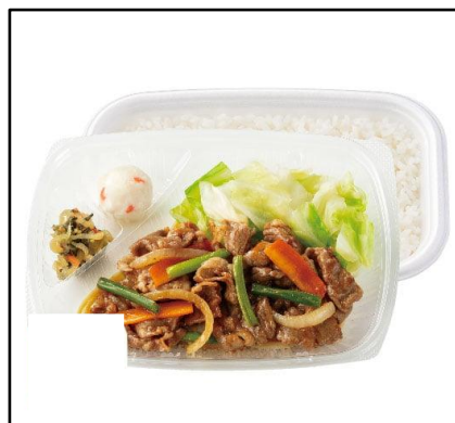
⑤ 牛焼肉弁当 740円