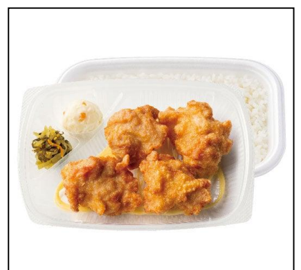
③ から揚げ弁当 590円