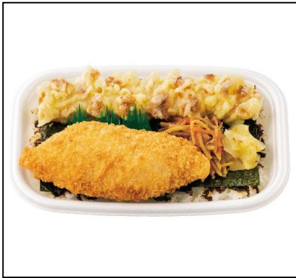
① のり弁当 470円