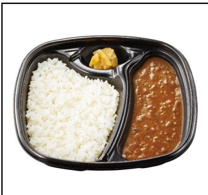
④ カレー弁当 610円