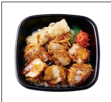
② とりめし弁当 600円